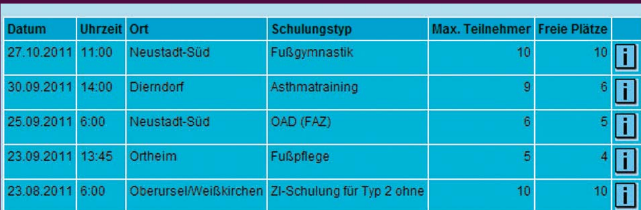
Abbildung 1: Die Schulungsübersicht